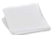
塗り込み専用クロス