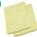
マイクロファイバークロス (※セットには付属しません。)